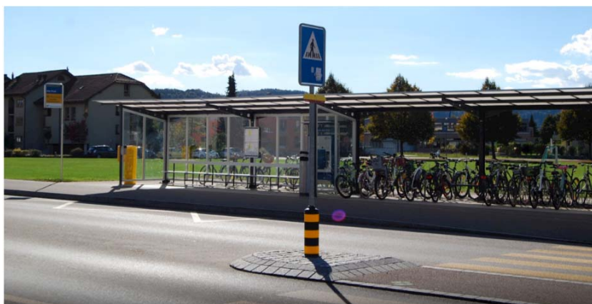
Haltestelle Alte Post

Nebst den effizienten Buslinien ist die Qualität und Lage der Haltestellen ein wichtiger Qualitätsfaktor der Erschliessung mit dem öffentlichen Verkehr. Bei Sanierungen oder Neuanlagen werden die Haltestellen überprüft und bei Bedarf mit zusätzlichen Ausstattungselementen versehen (Behindertengerechtigkeit (Frist 2023), Witterungsschutz, Sitzgelegenheit, Licht, Fahrplan, Abfalleimer und ggf. Veloabstellplätze).