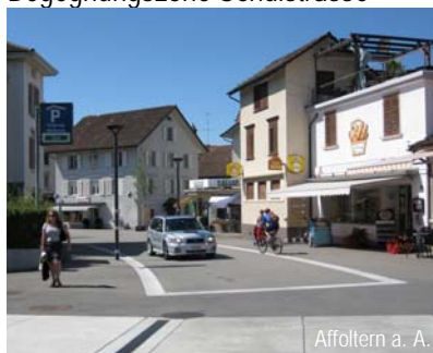
Prüfung einer Platzsituation – Begegnungszone Schulstrasse

Die Schulstrasse soll im bezeichneten Abschnitt einen wertvollen Aussenraum bilden, in welchem die Fussgänger zwischen den Läden zirkulieren und sich aufhalten können. Fahrzeuge sollen aber dennoch weiterhin mit Rücksicht auf die Fussgänger zirkulieren dürfen.