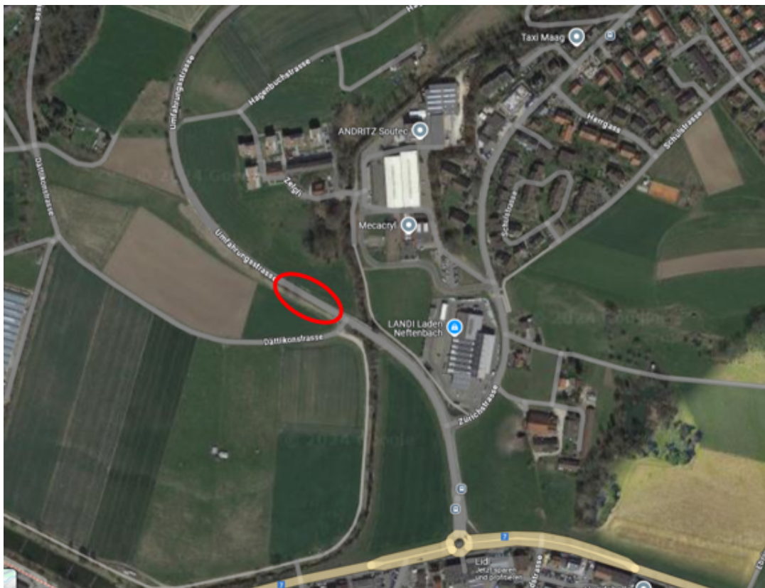
Abbildung : Übersicht Standort Verkehrszähler und Kameras der Messstelle, Umfahrungsstrasse in Neftenbach